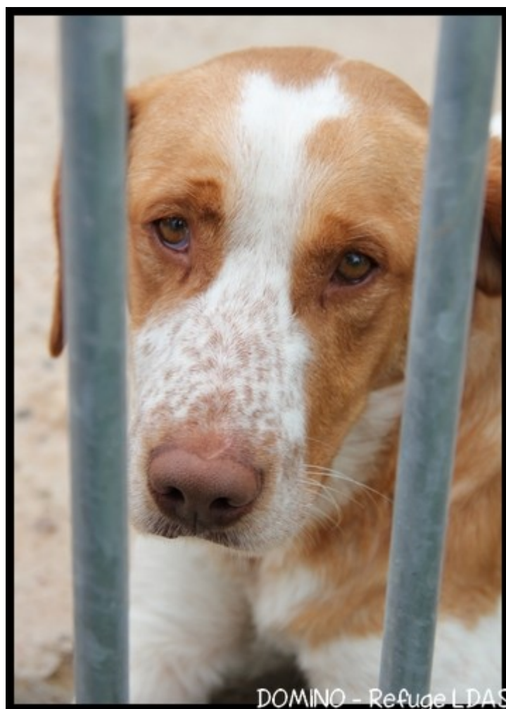
DOMINO - Refuge LDAS

Il existe également des associations qui placent des chiens en famille d'accueil, n'hésitez pas à les contacter.